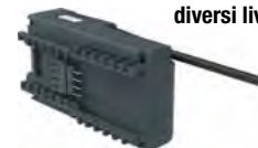
Caricabatteria N 9126/12