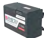
Batteria N 9126/11

Funzione "dimmer" per regolare l'intensità in 5 diversi livelli