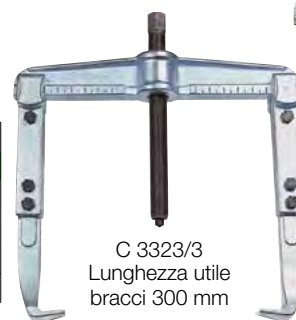
C 3323/3 Lunghezza utile bracci 300 mm