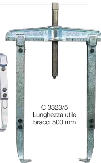
C 3323/5 Lunghezza utile bracci 500 mm