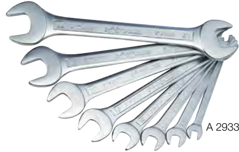
A 2933/1 pz. 8