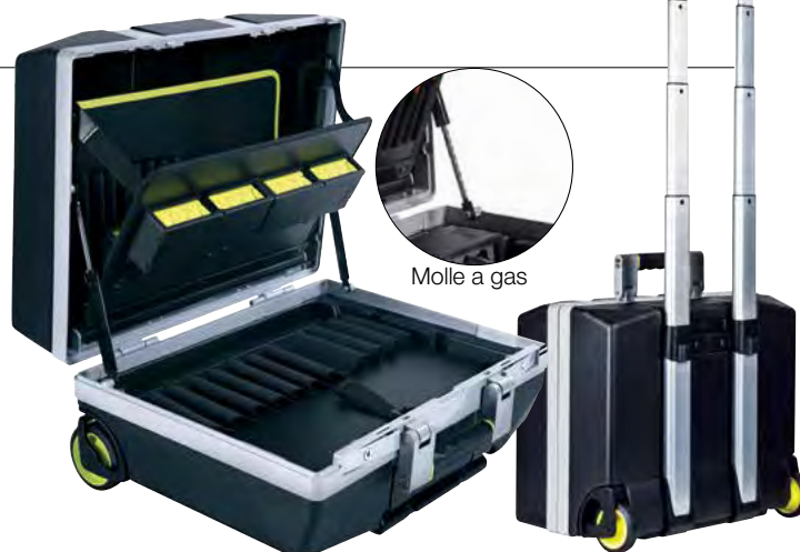
Molle a gas